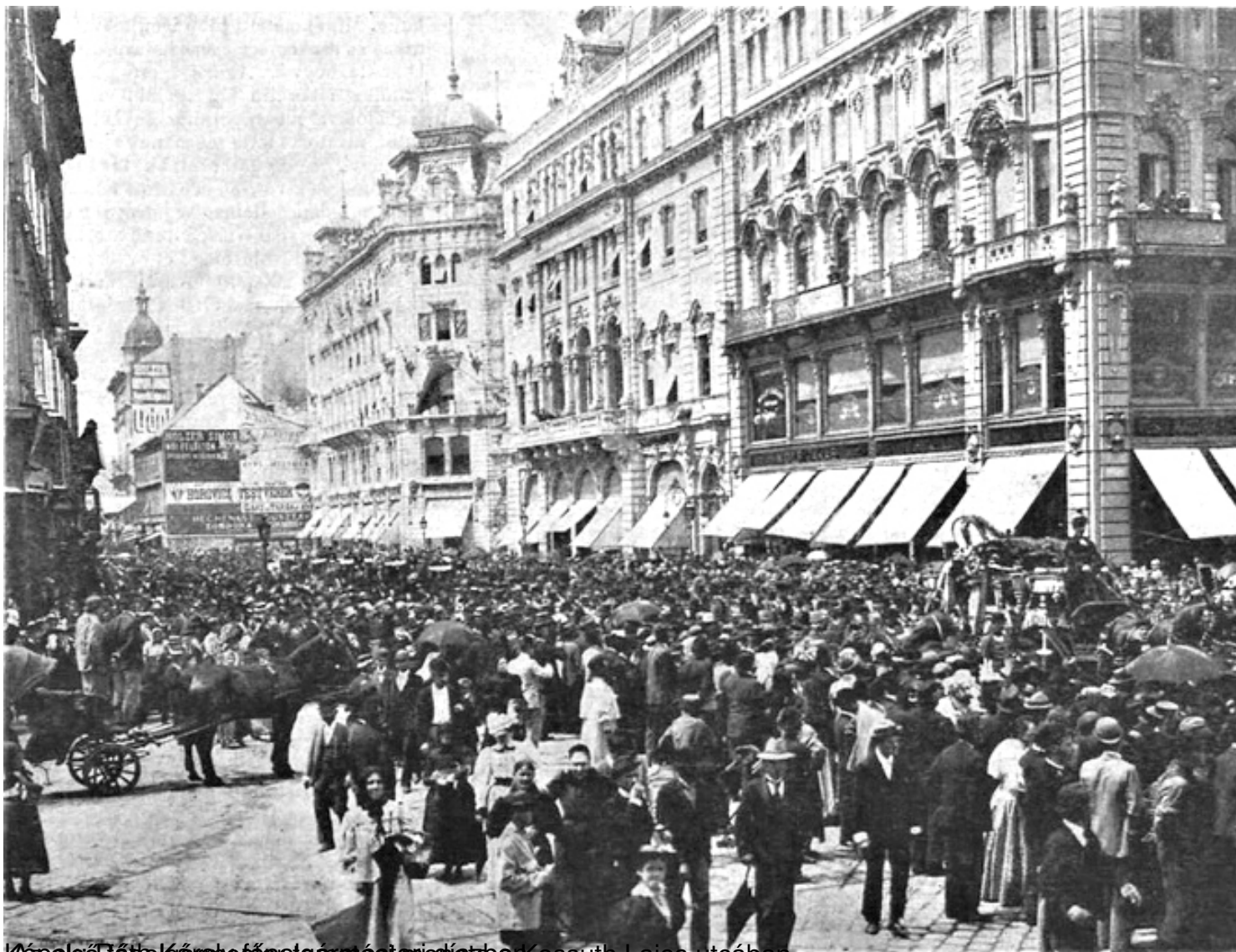
Kossuth Lajos utca, Budapest, 1900 körül. A képen látható a Kossuth Lajos utcában